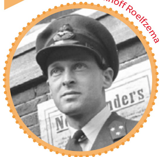
Erik Hazelhoff Roelfzema

Wanneer nazi-Duitsland in 1940 Nederland binnenvalt, heeft de Leidse student Erik Hazelhoff Roelfzema met zijn vrienden een onbezorgd studentenleven. Als Nederland bezet wordt door nazi-Duitsland, realiseren de vrienden zich, allemaal twintigers, dat niets meer hetzelfde is. Vriendschap en liefde zijn niet langer vanzelfsprekend. De oorlog zet alle verhoudingen op scherp. Iedereen moet zijn eigen keuzes maken: Ga je vechten voor vrijheid? Steek je je kop in het zand en studeer je door? Of kies je voor de kant van de de vijand?