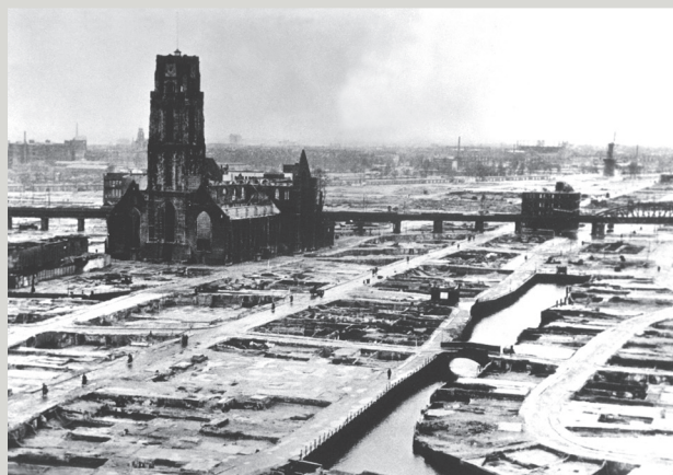
Bombardement op Rotterdam. Hierna geeft Nederland zich over.