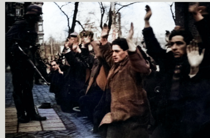
Razzia's in de Jodenbuurt van Amsterdam. Ongeveer 400 Joodse mannen worden opgepakt.