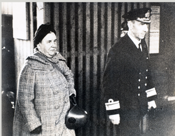
Koningin Wilhelmina vlucht naar Londen.